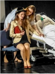
A la vie, à la mort – 2017