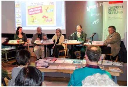
Soziale Republik versus Soziale Marktwirtschaft - 2017