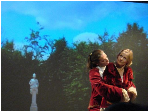
André Le Nôtre 2007/2009