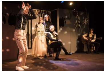
Comédie musicale Peau d'âne – 2018