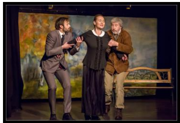
Tschechow und Turgeniew – 2018