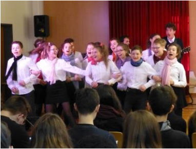
Aufführung in Französisch durch Schüler