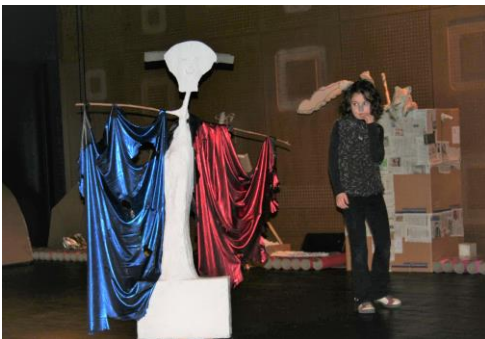
Histoires de poubelles 2008