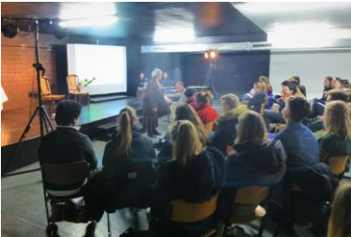
Aufführung in Französisch mit Schülern