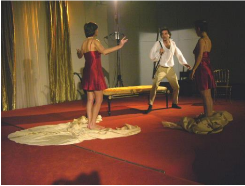
Les deux Phèdre-2005