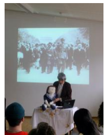
Les deux Agathe – 2019